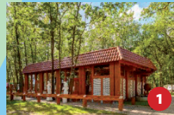
Sanitär ♀ und ♂ - unisex