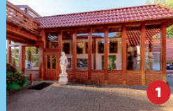
Sanitär ♀ | ♂ - getrennt